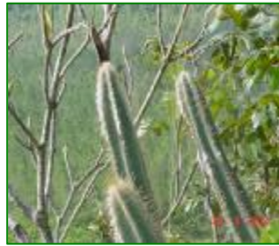
Pilosocereus sp. en su hábitat natural

Secuencia de imágenes que ilustra el trabajo realizado en el proyecto de restauración de la población de una especie del género Pilosocereus no descrita aun para la ciencia, esta especie es endémica de Villa Clara, Cuba y se encuentra en peligro crítico de extinción.