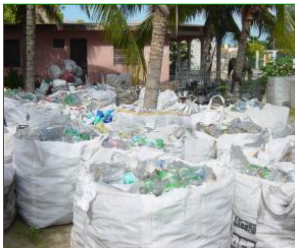
Foto 2. Material acopiado por las socias del grupo.

Estas actividades han generado nuevas iniciativas comunitarias en poblaciones vecinas, donde ya se han formado otros grupos comunitarios para el manejo de los residuos. Ahora se busca incrementar el esfuerzo de acopio de residuos inorgánicos no peligrosos, iniciar el acopio de materiales peligrosos no restringidos como pilas, baterías, envases y empaques de agroquímicos e insecticidas caseros, mismos que se entregarán a una empresa privada especializada en su manejo. También se acopiarán los medicamentos caducos, los cuales se entregaran para su neutralización al Centro de Medicamentos de la Facultad de Química de la Universidad Autónoma de Yucatán.