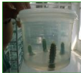
Pilosocereus sp propagado in vitro