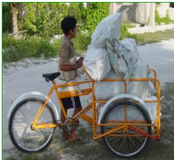
Foto 3. Niño de la comunidad entregando sus plásticos acopiados en áreas públicas.

Esta experiencia ha demostrado que el manejo y aprovechamiento comunitario de residuos antropogénicos, es una perspectiva novedosa que permite la eliminación paulatina del paradigma oficial, sustituyéndolo por uno nuevo, definido y construido desde la sociedad civil.