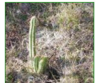
Pilosocereus sp plantado en áreas naturales