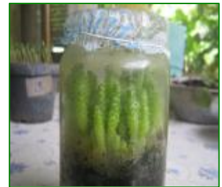
Método de cultivo tradicional utilizado para su propagación