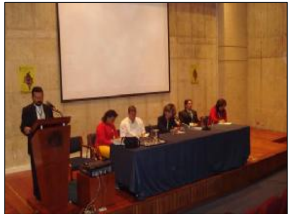
Foto 1: Instalación del I Simposio Nacional de Experiencias de Restauración Ecológica.