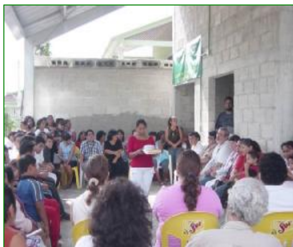
Foto 1. Inauguración del Centro Comunitario de Acopio.

forma participativa el proyecto y se sometió a diversas fuentes de financiamiento. Algunas instituciones apoyaron el proyecto con montos económicos de diversa magnitud, los cuales permitieron la construcción e inauguración del Centro Comunitario de Acopio de Residuos Inorgánicos no Peligrosos (foto 1), en el cual se ha logrado acopiar y comercializar 3.5 toneladas de residuos al mes desde hace más de 12 meses, lo cual representa 42 toneladas anuales (foto 2), es decir aproximadamente el 20% de los residuos inorgánicos generados en la localidad. Se equipó a las 23 socias con triciclos, herramientas y recipientes para la realización de las actividades de acopio (foto 3)