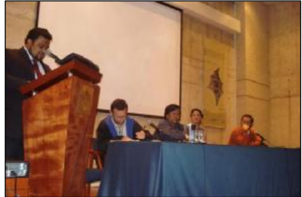
Foto 3: Primera asamblea de la Red Colombiana de Restauración Ecológica

(RCRE) se llevó a cabo el 3 de agosto, en este espacio la ERE presentó un informe de la labor realizada durante los diecisiete meses en los que estuvo a cargo de la convocatoria para la conformación de la RCRE. Durante este tiempo, se realizó la propuesta de los objetivos de la Red, se contactó a las entidades e investigadores interesados en el tema en el país que quisieran ser parte de la iniciativa y se realizó el diseño y publicación de cinco boletines trimestrales.